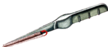
Flossbrush form och spets gör att en och samma kommer åt att rengöra i alla mellanrum.

Enklare kan man inte göra rent mellan tänderna.